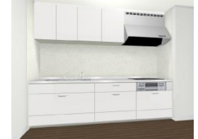
システムキッチン/アレスタ

使い勝手の良いシステムキッチンと程よく視線を遮るカウンター収納との組み合わせです