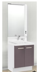
洗面化粧台/ピアラ