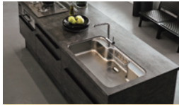
調理が楽しいキッチン

月々 29,000円 ~ (工事総額 300万円、頭金126万円を想定) 商品画像はイメージです。