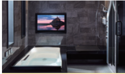
ゆったりできる浴室