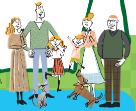
Illustration © LIXIL + SHILUSHI All Rights Reserved.

耐震化を高め、エコ住宅に長く住んでいただくために、持ち家の省エネ性能を向上させるリフォーム(エコリフォーム)に対して補助金がもらえます。リフォーム後の住宅が耐震性を有することが条件です。