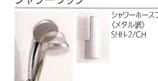
シャワーホースフック(メタル調) SHH-2/CH 角度調節式シャワーフック(メタル調)(2個) BF-FC30-PU1