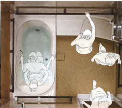
※浴室サイズ・ドア位置・ドア種類によりフラットサポートバー・握りバーの設置数や位置が異なります。

ユニバーサルデザインにこだわったアイテムや使いやすい動線に配慮したレイアウトなど、快適なバスタイムをサポートします。