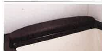
ヘッドレスト(ブラック)