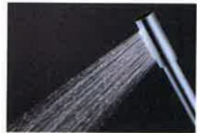
専用シャワーヘッド セナ