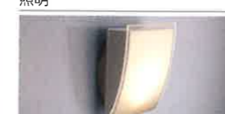
ネオスライス照明(LED) LE-L1-1A