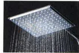
シャワーシステム(スクエア)

スライドバーと一体化したコンパクトなシャワーシステム。壁付サーモ水栓と組み合わせています。