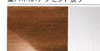
アクセントパネル:チェリー(鏡面)/HN661 ベースパネル:ホワイト(EB)/LE701