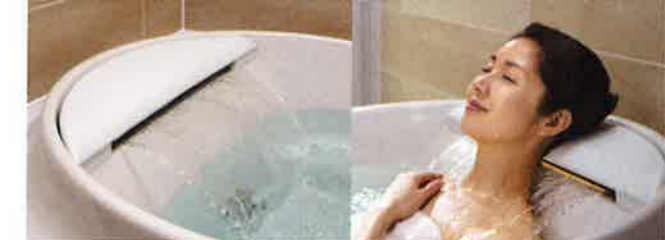
※画像は、アクアフィールライト付です。