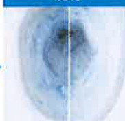
従来陶器 アクアセラミック