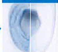
従来陶器 アクアセラミック