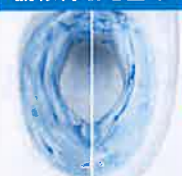
従来陶器 アクアセラミック